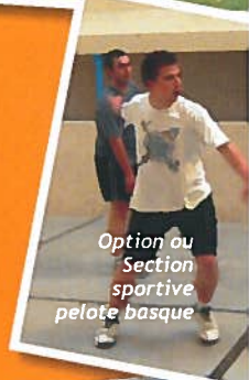
Option ou Section sportive pelote basque

Elles font partie du planning hebdomadaire d'Errecart. C'est un rendez-vous que nos jeunes ne veulent pas manquer. Chaque lycéen a l'opportunité de s'y inscrire en début d'année ; rien n'est imposé.