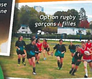
Option rugby garçons / filles