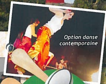
Option danse contemporaine

spécialité Biologie-Ecologie ou Mathématiques ou Physique-Chimie ou Sciences Economiques et Sociales.