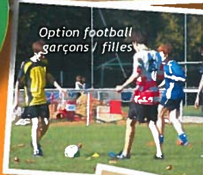
Option football garçons / filles