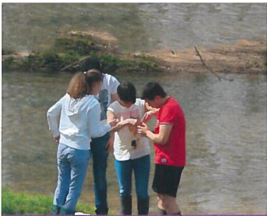
Ecologie, Agronomie, Territoire et développement durable.