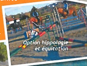
Option hippologie et équitation