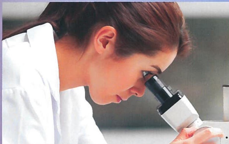
Travaux Pratiques de biologie