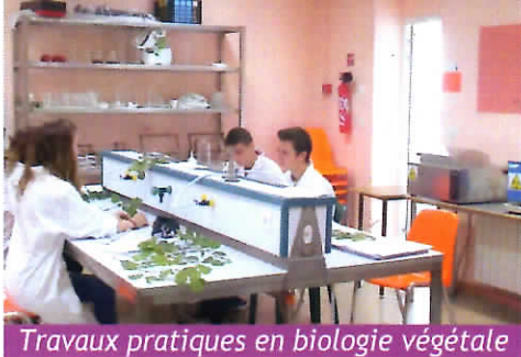
Travaux pratiques en biologie végétale