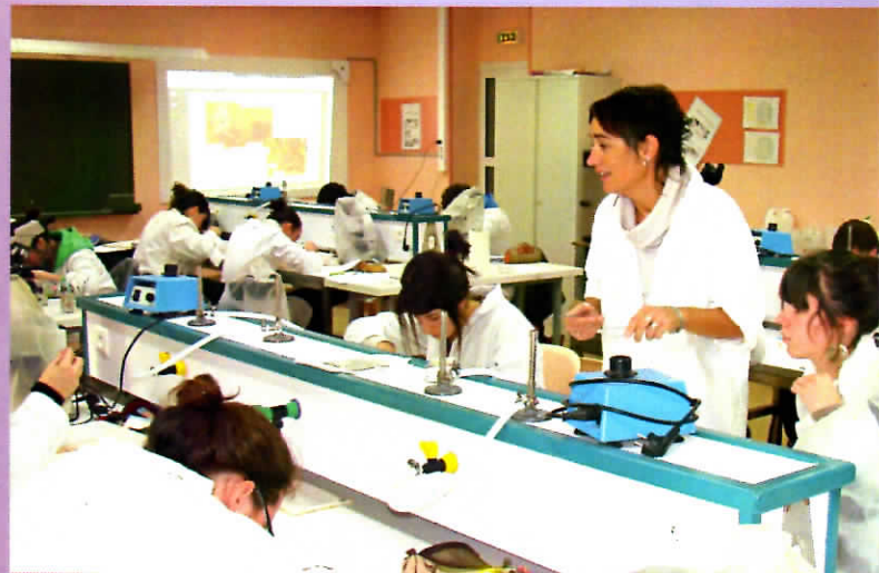
Travaux Pratiques en biologie