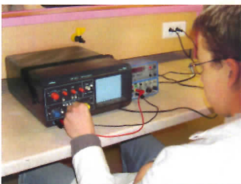
Travaux Pratiques en physique