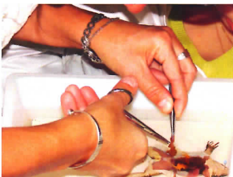
Dissection en laboratoire