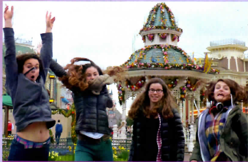
Voyage d'étude (Paris, Provence, Monaco...)