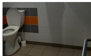
Toilette pour les personnes à mobilité réduite