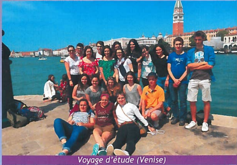
Voyage d'étude (Venise)