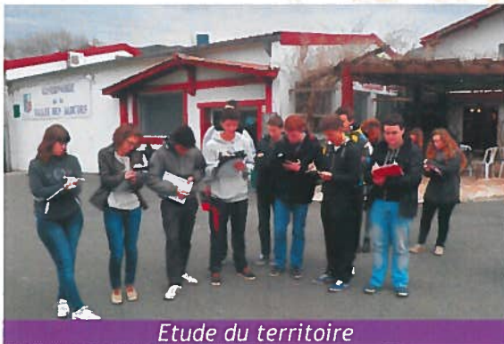
Etude du territoire