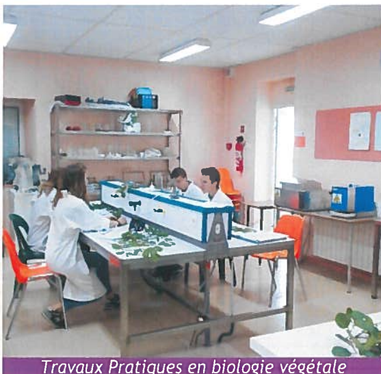
Travaux Pratiques en biologie végétale