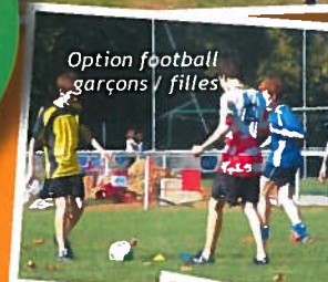
Option football garçons / filles