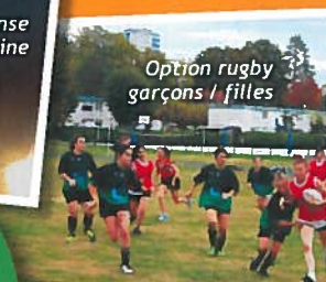
Option rugby garçons / filles