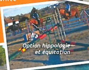
Option hippologie et équitation