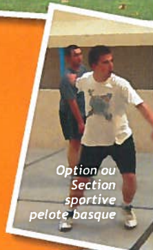
Option ou Section sportive pelote basque

Elles font partie du planning hebdomadaire d'Errecart. C'est un rendez-vous que nos jeunes ne veulent pas manquer. Chaque lycéen a l'opportunité de s'y inscrire en début d'année ; rien n'est imposé.