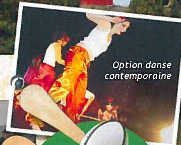
Option danse contemporaine