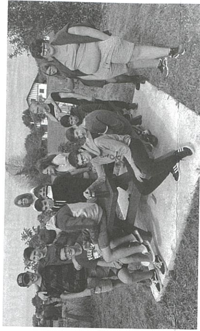
Les élèves de 3 e EA.